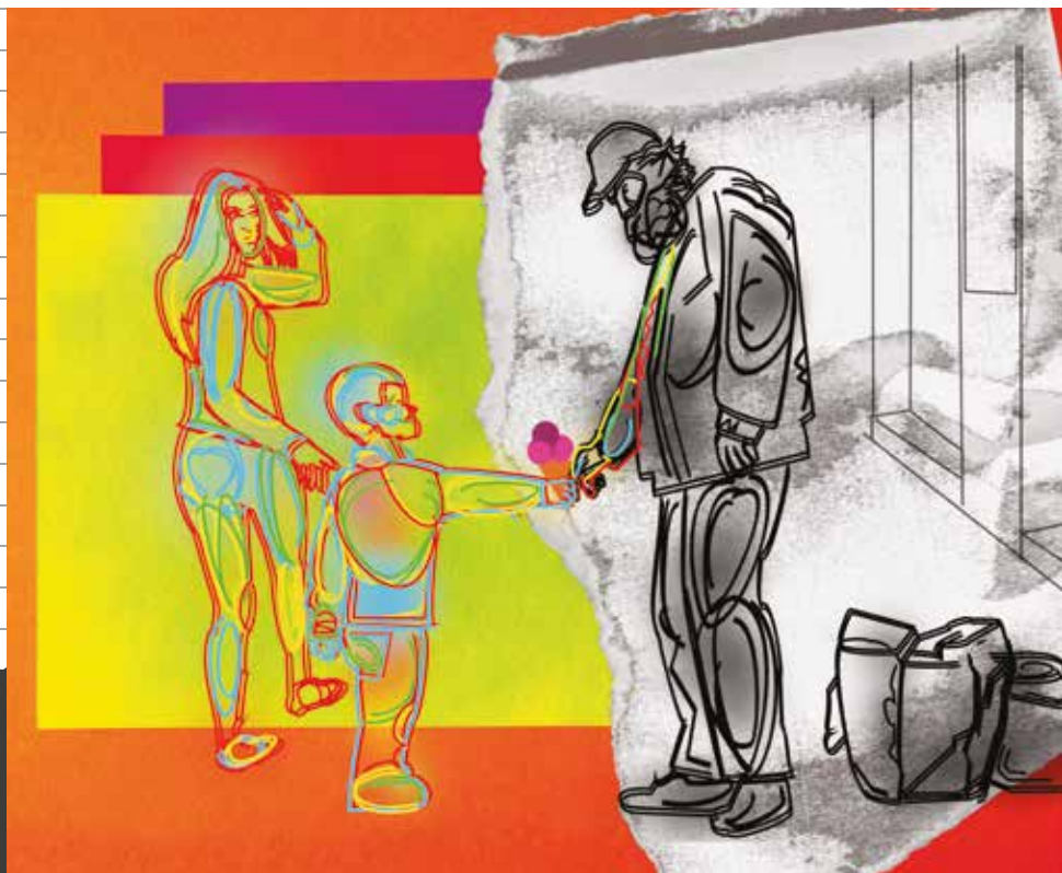
ILUSTRÁCIA: Korinna Kozma